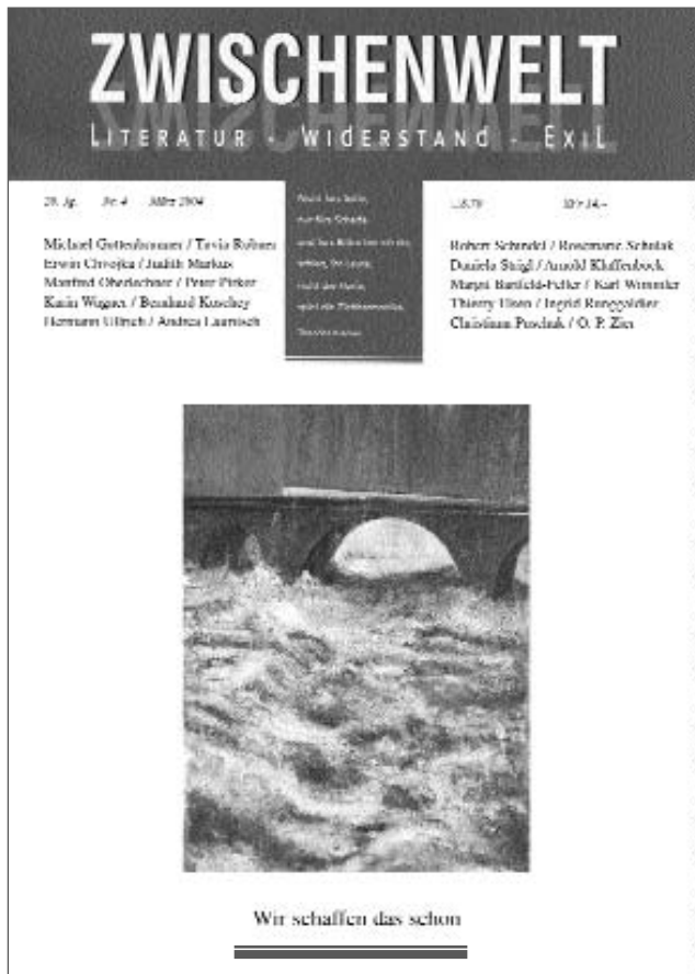
Cover Zwischenwelt, 20. Jg. Nr. 4/März 2004

mengestellt von Bruni E. Blum); Nr. 4/Februar 2002 „Lebenswege“. (Schwerpunkt: Kinder in der Verfolgung, im Exil und in der Literatur. Zusammengestellt von B.E. Blum). 19. Jahrgang 2002: Nr. 1/Mai, Doppelheft „Exil in der Heimat – Palästina/Israel“ (Hg. und zusammengestellt von Evelyn Adunka); Nr. 2/Oktobre Doppelheft „Wien, Mexikoplatz“; Nr. 3/Dezember „Über Flucht und Wiederkehr“; Nr. 4/Februar 2003 „Aufklärung, Gegenklärung“. 20. Jahrgang 2003: Nr. 1/Mai „Kabarett im Exil“ (Hg. und zusammengestellt von Marcus G. Patka und Regina Thumser); Nr. 2/September „Album der schönen Unbekannten“; Nr. 3/Dezember „Jean Améry“ (Gestaltung des Schwerpunktes Gerhard Scheit); Nr. 4/März 2004 „Wir schaffen das schon“.